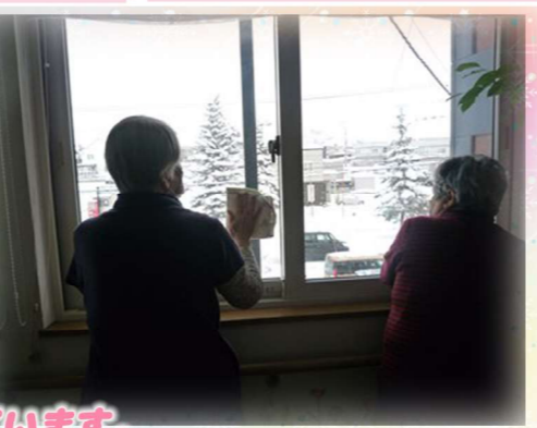
大掃除も皆さんと協力しながら行っています。