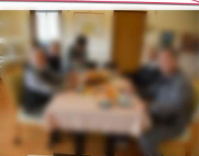
運営推進会議も開催致しました。

災害を含めた日中想定... 設備の点検も行っており... 委員会では、訓練の安全チェックと今後の災害について話し合いを行っております。